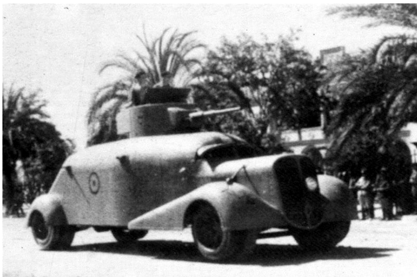
Тизнаос — бронированный грузовик, сделанный умельцами

Колонна Аскасо была третьей колонной, организованной в Барселоне. Она ушла на фронт 25 июля 1936 г. 1 , имея в своем составе 2.000 добровольцев. На вооружении колонны было 4 или 6 пулеметов, а также 3 или 4 бронированных грузовика, переоборудованных металлургами Гава ( Каталония ). К колонне Аскасо присоединились интернациональные группы « Справедливость и свобода » и Батальон смерти ( или центурия Малатесты ). Колонна расположилась в районе Уэски, командовали ею Крестобаль Альдабальдетреку, Григорио Ховер и Доминго Аскасо.