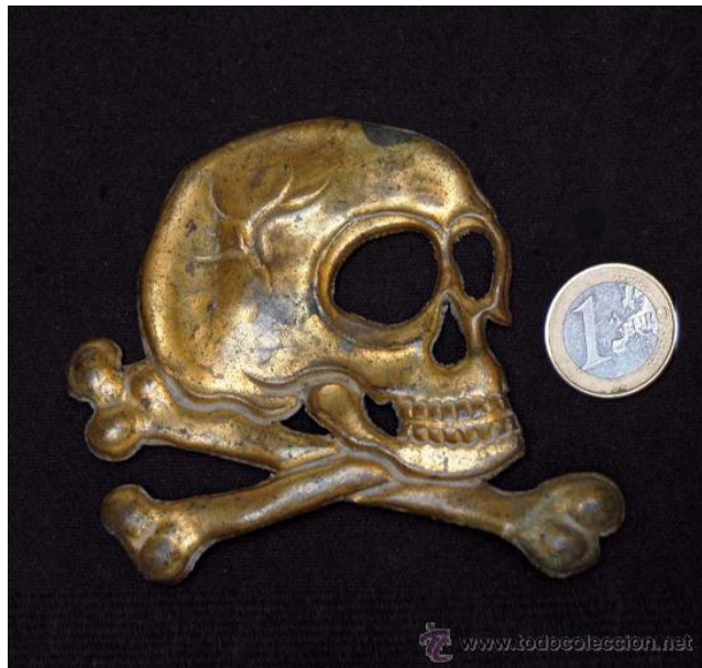
Кокарда «Батальона смерти»

Вольный перевод с испанского с использованием других материалов 2 А. Фёдоров