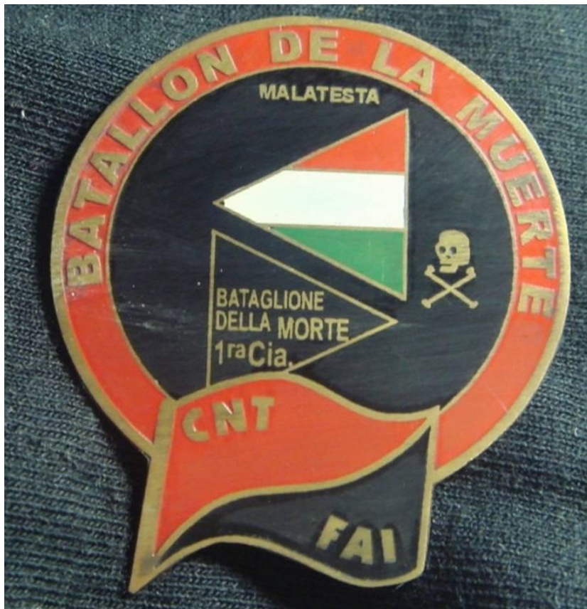
Значок «Батальон смерти»