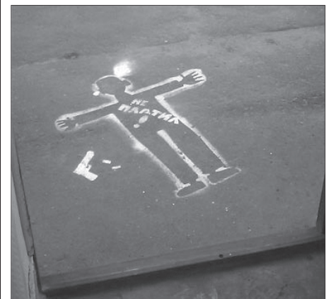
Последнее предупреждение начальнику