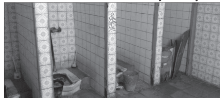
Туалет на одной из подстанций скорой помощи

Как нам показалось, врачи настроены по-боевому, поскольку терять им в сущности нечего. Ситуация в нашей стране такова, что наиболее важные профессии, как то врачи или учителя, от работы которых зависит наше здоровье и будущее наших детей являются наиболее незащищенными категориями трудящихся. Власти тратят бюджетные деньги на свои прихоти, строительство новых резиденций или проведение чемпионата мира по хоккею, но экономят на врачах и других трудящихся, которые вынуждены работать буквально за копейки в очень тяжелых условиях. Чтобы изменить эту ситуацию нам необходима солидарность со всеми протестующими и борющимися за свои права работниками. Только вместе мы сможем изменить что-то к лучшему!