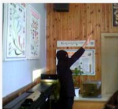
Наци в школе. Бойтесь!

Это небольшая подборка деятельности солигорских нацистов. Мы не стали подробно разбираться в их ущербном существовании и копаться в гнилой идеологии. Данный информационный материал, не полностью отображает масштаб нацистских настроений. Но этого достаточно чтобы не сидеть, сложа руки, и помогать нацистам своим бездействием.